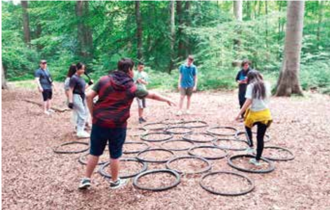
Die Gruppe wächst zusammen

→ Das Projekt richtete sich an Geflüchteten-Gruppen, auch in Familienverbänden. Es wurde in DAZ-Klassen und in den Gemeinschaftsunterkünften für das erlebnispädagogische Angebot geworben.