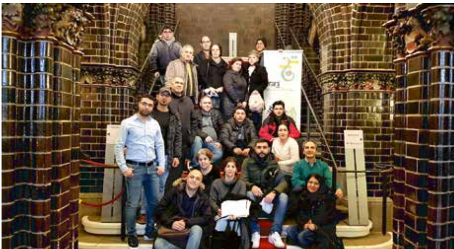
Besichtigung des Lübecker Rathauses

→ Mit dieser Entdeckungstour wollte der Verein Toranj Neuzuwander:innen, die persisch- und arabischsprachig sind, in Lübeck willkommen heißen, ihnen helfen, die Stadt kennenzulernen, mit Menschen in Kontakt zu kommen und Freunde zu finden. Niemand sollte das Gefühl haben, auf sich allein gestellt zu sein, besonders wenn die Sprache noch nicht gut beherrscht wird und die neue Heimat noch unbekannt ist.