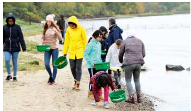
Material Sammeln für ein Landart-Projekt während des talentCAMPus auf dem Gelände des Landschaftspflegevereins Dummersdorfer Ufer

Alle Projekte und Maßnahmen wurden in engster Zusammenarbeit mit den Betreuer:innen der GU durchgeführt. Es bestanden tragfähige Kooperationen mit ePunkt e.V., der VHS, dem Projekt KidZCare des Fördervereins für Lübecker Kinder e.V., der Kirchengemeinde St. Lorenz, Travemünde sowie den Musikpädagog:innen der ‚Tontalente‘ und ‚123musik‘ der Musikschule in Travemünde sowie der Stabsstelle Integration der Hansestadt Lübeck.