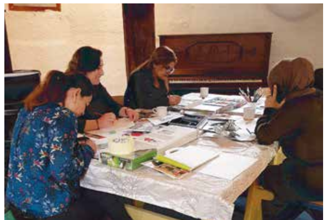
Kreativ beschäftigte Frauen