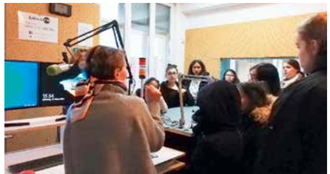
Einführungskurs im Offenen Kanal

Der Verein Frauen helfen Frauen möchte über seine Arbeit erreichen, dass mehr Mädchen und junge Frauen mit Verantwortung umgehen und selbstbewusst in Führung gehen können.