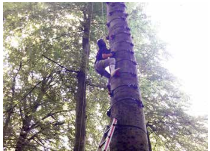
Abenteuer machen stark

Das erlebnispädagogische Programm von EXEO sollte die Schüler:innen zudem dabei unterstützen, sich an ein Zusammenleben zu gewöhnen und ein Gemeinschaftsgefühl zu erfahren, um dieses in der Klasse/Gruppe zu verfestigen. Ziel der Tagesprogramme war es, dass die Kinder und Jugendlichen an Selbstwertgefühl gewinnen und erfahren, dass Vielfalt eine Bereicherung in unserer Gesellschaft ist und Abenteuer stärken!