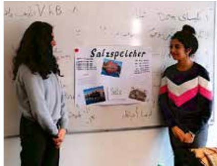
Die Kinder präsentieren ihre Plakate über Lübeck auf Deutsch und Farsi