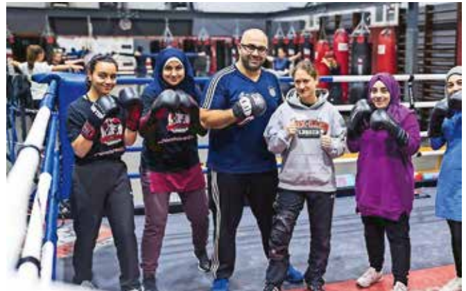
Die Boxerinnen mit ihrem Trainer

Die Arbeit mit den Frauen und Mädchen hat sich für den Boxclub als sehr fruchtbar erwiesen. Die Projektleitung resümierte, dass es viel Spaß gemacht habe, die Entwicklung der Mädchen und Frauen zu beobachten und ist sich sicher, dass diese Arbeit nachhaltige Wirkung gezeigt hat: „Der Erfolg der Projektarbeit gehe über die Grenzen der einzelnen Person hinaus und so konnte auch ein Umdenken und eine Akzeptanz in dem Umfeld vieler beteiligter Personen erreicht werden.“