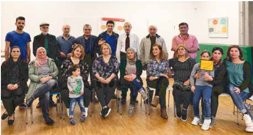
Häusliche Gewalt ist kein Schicksal sondern ein lösbares Problem

→ Häusliche Gewalt ist ein gesellschaftliches Problem, das gravierende negative Auswirkungen auf das Individuum, die Familie und die Gesellschaft hat.