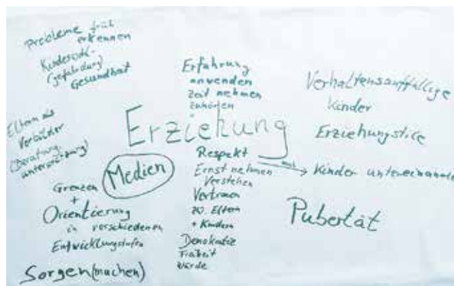
Themenwand zum Vertiefungstreffen Erziehung

Das Thema für das nächste Treffen sollte das Schulsystem in Deutschland sein und natürlich die häufigste Frage vieler Eltern aufgreifen: „Welchen Beruf kann mein Kind mit welchem Schulabschluss ergreifen?“.