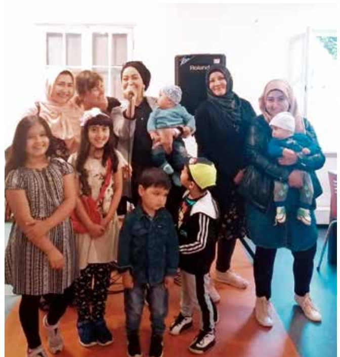
Die Frauen aus dem Frauencafé singen über die Lautsprecheranlage

Rund vierzig bis sechzig Menschen mit Fluchthintergrund, insbesondere geflüchtete Frauen haben bereits zusammen mit allen anderen Nutzer:innen des Solizentrums, des Frauencafés, des Gesprächscafés sowie Teilnehmerinnen der ‚Mama lernt Deutsch-Gruppe‘ von der Lautsprecheranlage profitiert und sie für verschiedene Zwecke eingesetzt.