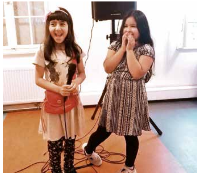
Die Kinder aus dem Frauencafé singen über die Lautsprecheranlage

Vollfinanziert aus dem Lübecker Integrationsfonds