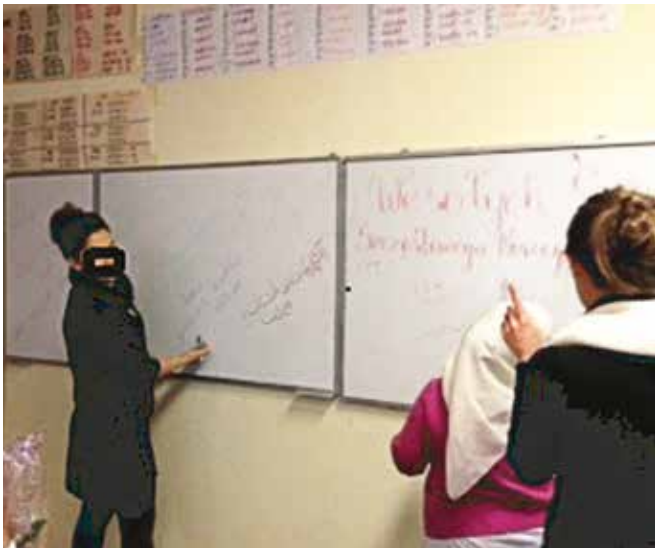
Fortbildung zur Gewaltprävention

Geflüchtete Frauen und Mädchen sowie Migrantinnen sind hiervon in besonderer Weise betroffen und oftmals nicht ausreichend über ihre Rechte und Unterstützungsmöglichkeiten informiert.