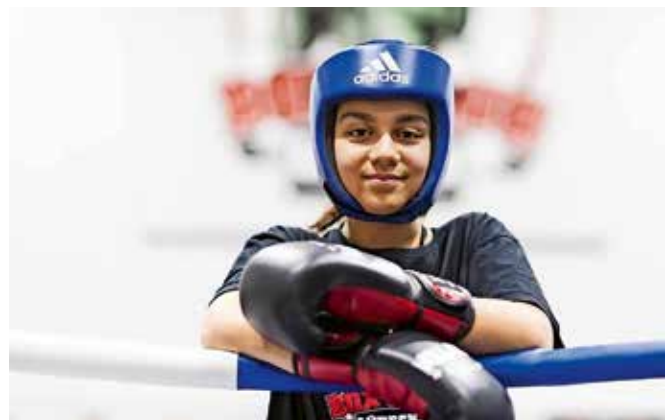
Zufrieden nach dem Training

7 Integrationsprojekt durch den Boxclub Lübeck Träger: Boxclub Lübeck e.V. Durchgeführt von: Tolga Tanriverdi Vollfinanziert aus dem Lübecker Integrationsfonds