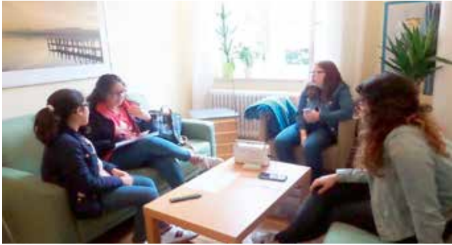
Arbeitstreffen, um eine Sendung vorzubereiten

→ Das Ziel des Projektes ist, dass die teilnehmenden Mädchen und Frauen im Alter von acht bis einundzwanzig Jahren, ihre Stimme mit einer Radiosendung erheben und darüber etwas bewirken.