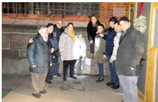
Besuch auf dem Lübecker Weihnachtsmarkt

Neben dem regulären Unterricht wurden verschiedene Aktivitäten geplant und durchgeführt, wie der Besuch des Lübecker Weihnachtsmarktes oder ein gemeinsames Abendessen. Alle Aktivitäten wurden in den Unterricht integriert und beispielsweise für Wortschatzarbeit genutzt. Das Feiern des jeweiligen Geburtstages der Teilnehmenden mit Kuchen, Kerze und Gesang gehörte ebenfalls zum festen Bestandteil des Grundkurses.