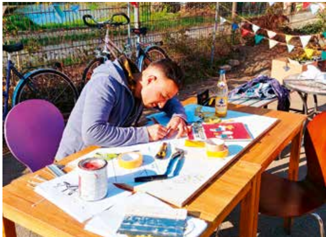
Vorarbeiten für die Fassadengestaltung

→ Die Planung und Umsetzung der Gestaltung der Außenfassade des Gebäudes Solizentrum, direkt an der Willy-Brandt-Allee gelegen, mit dem Schriftzug ‚Willkommen‘ in allen Sprachen, die im Solizentrum gesprochen werden, erfolgte gemeinschaftlich durch Frauen, Männer und Kinder mit Fluchthintergrund.