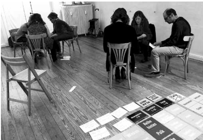
Gemeinsame Entwicklung des Hörstücks

→ In diesem Projekt hat eine Gruppe von anfangs zehn, schließlich fünf aktiven Teilnehmer:innen, divers in Alter, Geschlecht, kulturellen und biografischen Prägungen, jeweils eine weitere Person außerhalb der Gruppe interviewt, unter der Leitfrage: Wer und wie hättest du sein können?