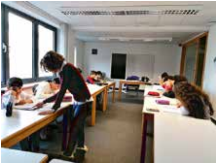
Anfänger Farsi-Kurs für Kinder