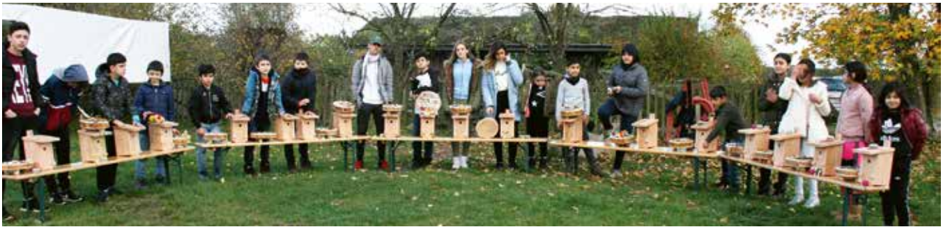
Abschlussgruppenfoto mit selbstgebauten Werken während des talentCAMPus auf dem Gelände des Landschaftspflegevereins Dummersdorfer Ufer

→ Ein ehrenamtlicher Kreis, aus 20 Bürger:innen Travemündes, hat sich mit großem Engagement und Ausdauer seit dem Start der Gemeinschaftsunterkunft Ostseestraße in Travemünde zu einer Initiative zusammengeschlossen, um vor Ort Integrationsangebote zu schaffen. Etwa 260 Geflüchtete, darunter Alleinreisende, aber auch Familien und Kinder, leben seit Anfang 2017 in der Gemeinschaftsunterkunft der Hansestadt Lübeck.