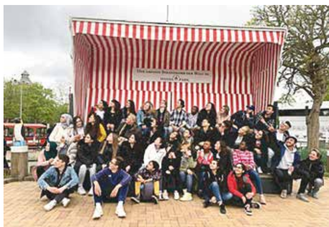
Der größte Strandkorb der Welt für KidzCare

Die – in Kooperation mit der VHS Lübeck und der Röhre – im Juli 2019 durchgeführte Talent-Campus-Woche war sehr erfolgreich. Vormittags wurde die Angebote Deutsch-Intensivkurs, Englisch und Politische Bildung genutzt, mittags wurde gemeinsam gegessen und gespielt. Nachmittags konnte zwischen einem Tanzkurs, einem Computer-Kurs und einem Nähkurs gewählt werden. Der für die Sommerferien 2020 angebotene Talent-Campus wird ebenfalls zur Teilnahme genutzt werden. Das im August 2019 gestartete Fotoprojekt wird sehr rege genutzt. Die Teilnehmer:innen sind gerade damit beschäftigt eine Ausstellung ihrer Fotokunst vorzubereiten.