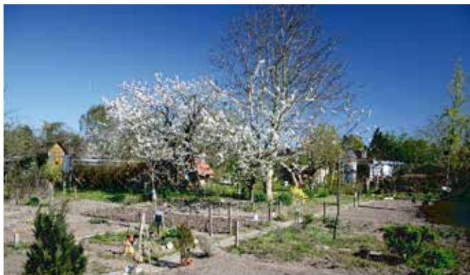
Die Interkulturellen Gärten im ‚Corona-Frühling‘

→ Begegnungen zwischen Menschen verschiedener Kulturen stehen im Mittelpunkt des Kooperationsprojektes zwischen dem Gemeinnützigen Kreisverband Lübeck der Gartenfreunde e. V., dem Kleingärtnerverein Buntekuh e. V., der Interkulturellen Begegnungsstätte – Haus der Kulturen und dem Verein Sprungtuch. Der Garten fungiert als Raum, in dem über das Gärtnern von- und miteinander gelernt werden kann.