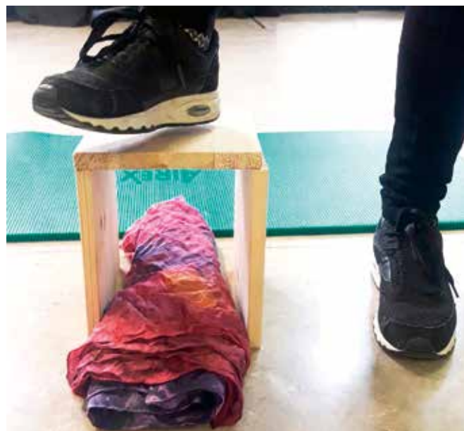
Die Frauen bei Trittübungen im WenDo-Kurs

Der Frauennotruf hat aus langjähriger Arbeit Erfahrungen, dass eine Stärkung der Selbstbehauptung in jedem Lebensbereich nachhaltige Wirkung bezüglich der Selbstbestimmung zeigt. Darüber hinaus können die Teilnehmerinnen auch Kenntnisse über die Angebote des Frauennotrufs und weitere Lübecker Hilfseinrichtungen weitergeben.