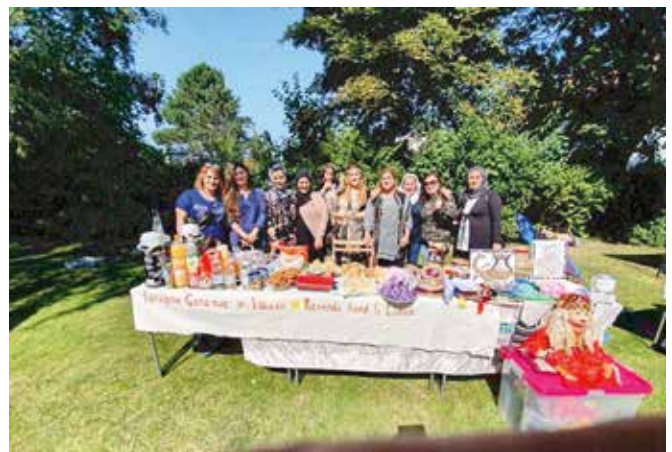
Teilnahme der Frauen aus dem Frauensalon am Stadtteilfest Buntekuh