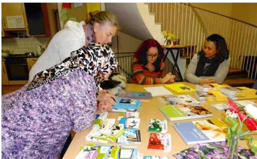
Gemeinsames Erarbeiten der Themenschwerpunkte

→ Bereits fünf ElternStärken-Kurse wurden erfolgreich von den Nachbarschaftsbüros der Hansestadt Lübeck durchgeführt. Die Kurse befassten sich in drei Modulen mit den Themen Erziehung, Bildung und Kultur. Eltern mit und ohne Migrationshintergrund sollten für den Umgang mit ihren eigenen Familien sensibilisiert werden, die Kurse zielten aber auch darauf ab, das erlangte Wissen als Multiplikator:in zu vermitteln. Von besonderer Bedeutung war, dass die Teilnehmer:innen ihre Kenntnisse in ihrer Muttersprache weitergeben konnten.