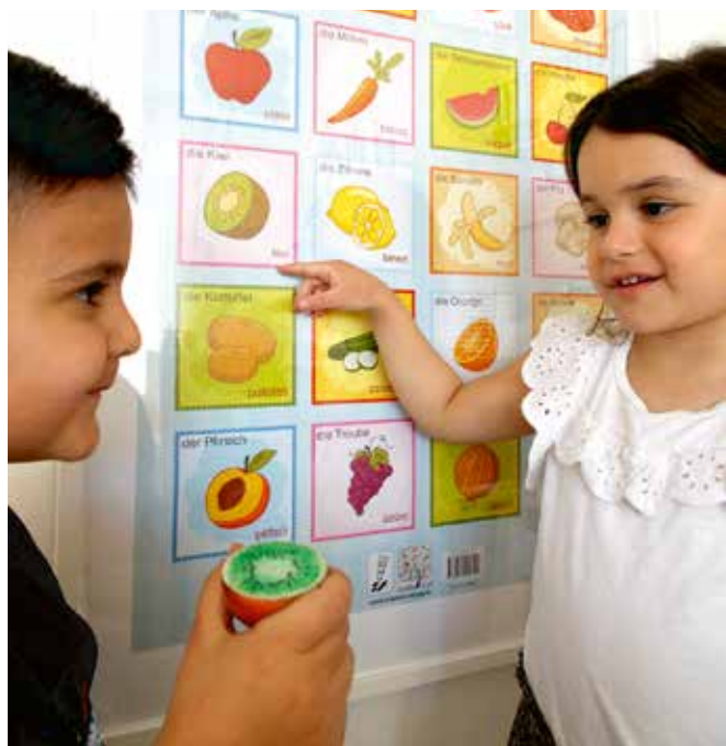
Lernen in zwei Sprachen

Zielgruppen des Projektes sind Kita-Kinder im Alter von einem Jahr bis zum Schuleintritt und deren Familien mit der Familiensprache Türkisch, ebenso aber auch Kinder, deren Eltern sich ein zweisprachiges Angebot wünschen.