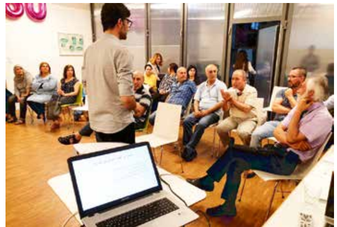
Dialog statt Gewalt

Der Weltmädchentag stand unter dem Motto ‚Starkes Mädchen, Starke Familie‘. Die jugendlichen Teilnehmer:innen führten in diesem Zusammenhang ein Theaterstück, zu den Themen Rollenverteilung in der Familie und Frühverheiratung, auf. Auch ein Vortrag über die Rollenverteilung wurde mehrsprachig gehalten.