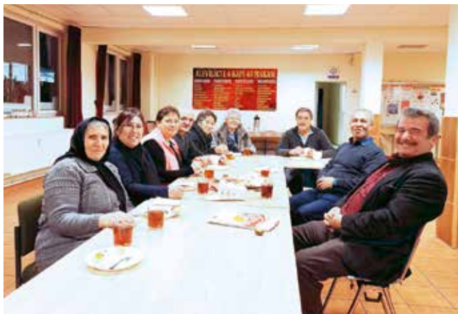
Gemeinschaftlicher Deutschkurs an einem Tisch

→ Da Sprache, Arbeit und Aufenthaltssicherheit die zentralen Schlüssel für die Teilhabe am gesellschaftlichen Leben sind, hat die Alevitische Gemeinde Lübeck einen Grundkurs Deutsch angeboten.