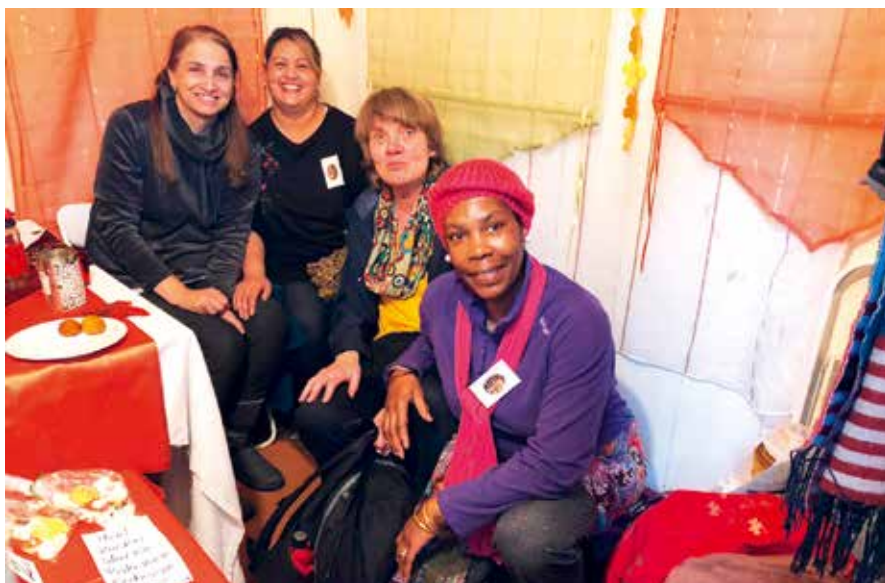
Teilnahme am Herbstmarkt der Hobbykünstler im Heiligen-Geist-Hospital

Das Sozialnetzwerk hat positive Auswirkungen auf die Lebenssituation der Frauen, sie gewinnen an Selbstbewusstsein, nehmen motiviert ihre eigene Lebenssituation in die Hand und haben durch das Netzwerk ein gewisses Sicherheits- und Wohlgefühl.