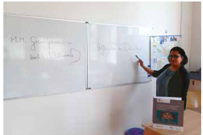
Mediatorin bei der Wissensvermittlung

Mit dem Lübecker Projekt und den durchgeführten Informationsveranstaltungen zu diesen Themen an verschiedenen Orten, wie Gemeinschaftsunterkunft für Frauen, Frauennotruf oder Nachbarschaftsbüro, konnten dreiundvierzig Frauen und Mädchen mit Migrationshintergrund erreicht werden.