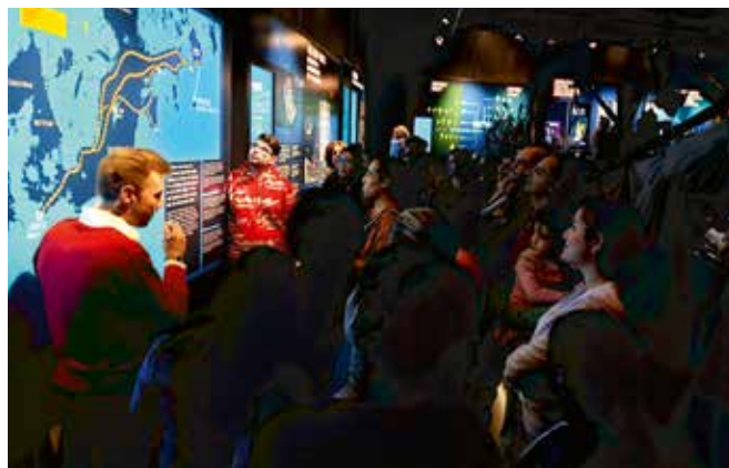
Eine Führung durch das Hansemuseum

Toranj ist sehr stolz auf den großen Anklang, den das Projekt gefunden hat und darauf, es den Teilnehmenden erleichtert zu haben, sich zu integrieren und ihre Stadt sowie viele neue Menschen kennengelernt zu haben. Der persönliche Bezug zum Wohnort wurde nachhaltig gestärkt.