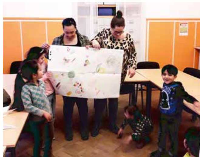
Die Kinder der ‚Regenbogenfrauen‘

Die Regenbogenfrauen sind inzwischen zu einem festen Bestandteil der Lübecker Integrationslandschaft geworden und präsentieren sich regelmäßig auf Ausstellungen, Messen oder nehmen an Veranstaltungsreihen teil.