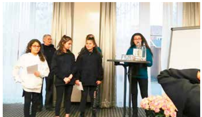
Präsentation des Projektes Radiogirls