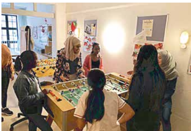
Eine Runde Tischkicker nach getaner Arbeit

Das ‚Hausaufgabenprojekt‘ in den DaZ-Klassen der Gotthard-ühl-Grundschule durch Ehrenamtler:innen läuft auch im fünften Jahr noch reibungslos, der Bedarf ist unverändert hoch. Der sehr gute Kontakt zu den Lehrer:innen ist besonders wichtig, um einzelnen Schüler:innen gezielter zu helfen. Besonders erfreulich ist, dass zum zweiten Mal – und diesmal dreizehn – Schüler:innen des Carl-Jacob-Burckhardt-Gymnasiums im Rahmen ihres Sozialcurriculums einmal wöchentlich bei den Hausaufgaben helfen. Außerdem unterstützt ein Schüler des Katharineums eine Berufsschülerin.