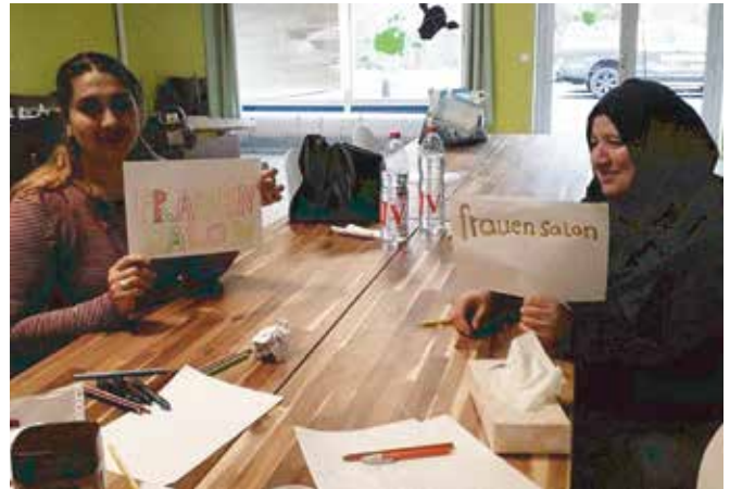
Wöchentliches Treffen der Frauen

für Frauen, in dem regelmäßig Gespräche und Austausch stattfinden können, für die Stärkung des Selbstwertes und der Selbstbehauptung und die Entfaltung von eigener Kreativität wichtig ist.