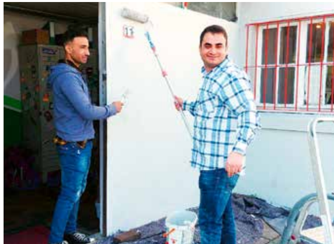
Die Malarbeiten an der Fassade

Sowohl die Planungsphase als auch die praktische Umsetzung wurden allein durch ehrenamtliches Engagement realisiert. Direkt durch die aktive Mitarbeit wurden ca. fünfunddreißig Teilnehmer:innen erreicht, insgesamt wurde das Projekt aber von vielen Geflüchteten als eine tolle Maßnahme zur Willkom-