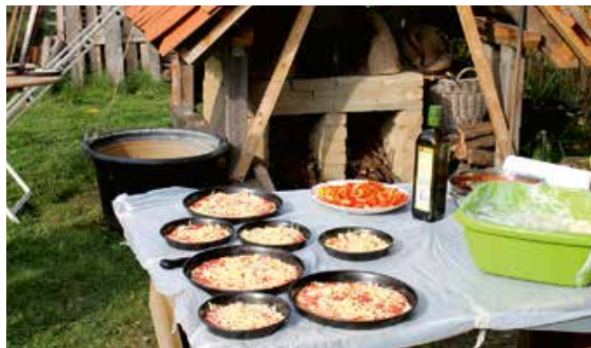
Der beliebte Steinofen in den Interkulturellen Gärten

Teilfinanziert aus dem Lübecker Integrationsfonds