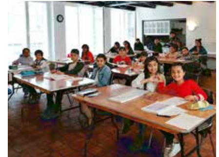
Abschlussprüfung nach der Corona-Krise in der Diele

→ Der Lübecker Kulturverein Toranj vertritt die Auffassung und kommuniziert dies auch, dass Integration und das Erlernen der deutschen Sprache grundlegend für das Leben in Deutschland sind. Dies bedeutet jedoch nicht, dass die eigene kulturelle Identität und dazu gehört auch die Muttersprache, aufgegeben werden muss.