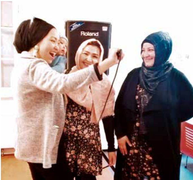
Das Frauencafé beim Sprechtraining über die Lautsprecheranlage

→ Zur Stärkung der Eigenwahrnehmung und des Selbstbewusstseins sowie zur Entwicklung des Sprachvermögens – insbesondere von Frauen – wurde eine mobile Lautsprecheranlage angeschafft und verschiedenen Angeboten, Initiativen und Projekten zur Nutzung zur Verfügung gestellt.