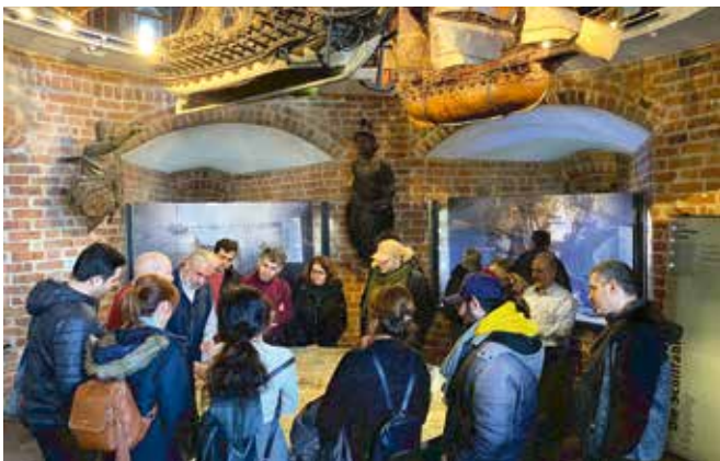
Besuch im Holstentor Museum

Zur Förderung der eigenen Integration, sollte Wissenswertes über die Stadt Lübeck und den eigenen Wohnort vermittelt werden, denn nur wer seine neue Heimat kennt, kann sie auf ganz andere Art und Weise wertschätzen, mitreden und schneller Freunde finden. Diese Möglichkeit bleibt leider vielen Neuzuwander:innen verwehrt.