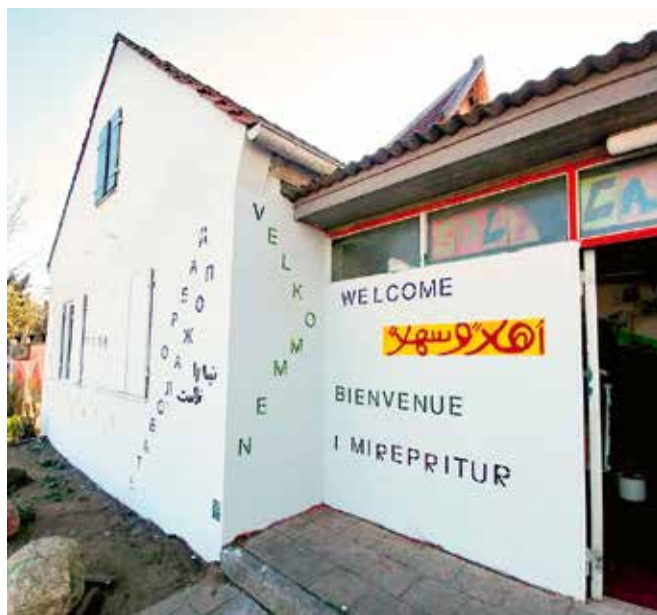
Die neu gestaltete Fassade mit dem Willkommensgruß

Positive Reaktionen erhält das Solizentrum bis heute von Geflüchteten und auch von Lübeck Besucher:innen, z. B. aus Skandinavien, auf die Gestaltung und den Wiedererkennungswert des Willkommensgrüßes in der eigenen Landessprache. Das Ziel der aktiven Teilhabe wurde gern von den Geflüchteten angenommen und umgesetzt. Die ausgeführte Maßnahme wirkt nachhaltig für eine Willkommenskultur in Lübeck, durch die Sichtbarkeit des Wortes ‚Willkommen‘ in zwanzig Sprachen auf einer Fassade im öffentlichen Raum.