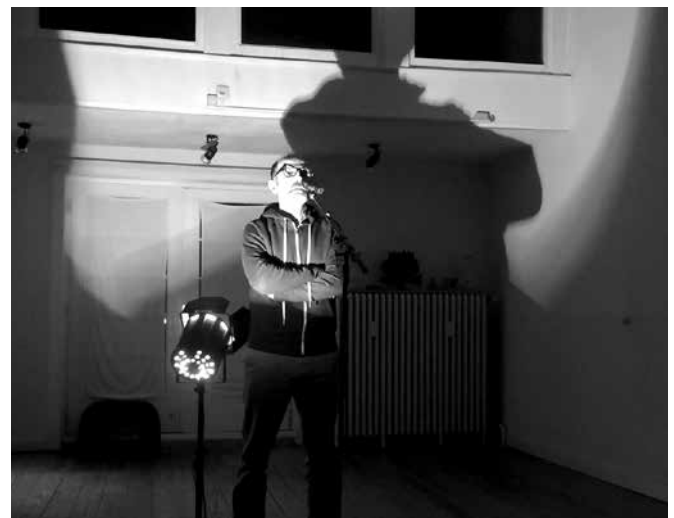
Szene einer Probe

https://aktionshunger.de/daslebenmeistern .