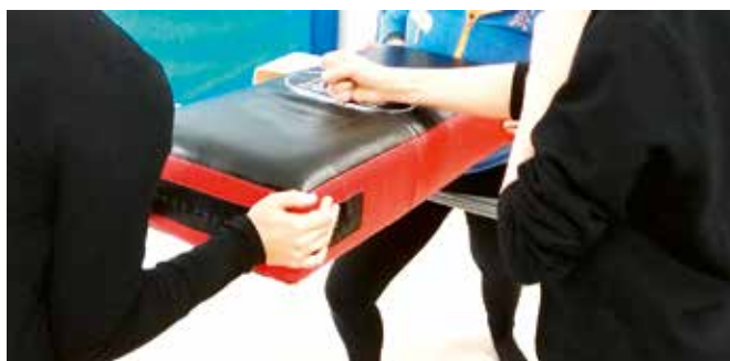
Die Frauen bei Schlagübungen im WenDo-Kurs

→ Dieses Angebot des Frauennotrufs bietet Frauen mit Flucht- und / oder Migrationshintergrund die Möglichkeit, durch Stärkung des Selbstvertrauens und der Selbstbehauptung zu lernen, sich in schwierigen Situationen besser durchzusetzen, zu schützen und zu verteidigen. Verknüpft mit Informationen über eigene Rechte und Hilfsmöglichkeiten, ist das Ziel, den Selbstschutz der Frauen vor sexualisierter, sexistischer und rassistischer Belästigung und Gewalt zu fördern.